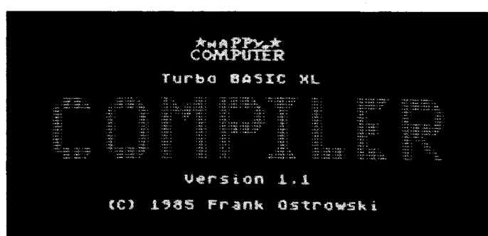
Bild 1. Das Titelbild des Turbo-Basic-Compilers

Wenn Sie also das Eingabeprogramm »AMPEL« vorliegen haben, starten Sie mit RUN und RETURN. Wählen Sie dann einen Namen, unter dem Sie das einzugebende Programm speichern möchten. Die Gerätebezeichnung ist bereits vor-